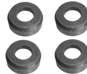
Gumowe poduszki mocowania tyłu zbiornika paliwa do ramy