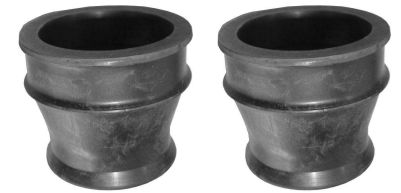
Mufy gumowe łączące filtr na zbiorniku z kolektorami dolotowymi