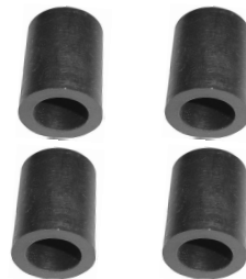
Łączniki gumowe osłon lasek popychaczy