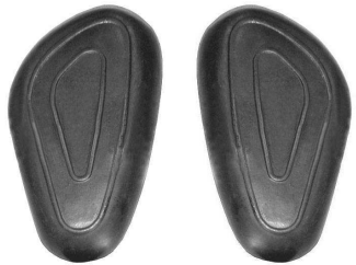
Gumowe poduszki na zbiorniku paliwa