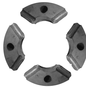
Elementy gumowe przegubu wałka napędowego