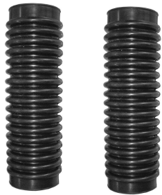
Oślony gumowe goleni widelca