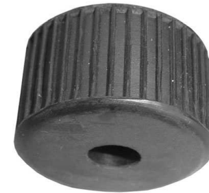
Końcówka gumowa nożnej dźwigni zmiany biegów