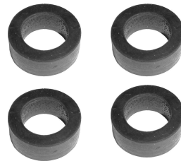
Uszczelniacze uchwytów dźwigiemek zaworowych. II model