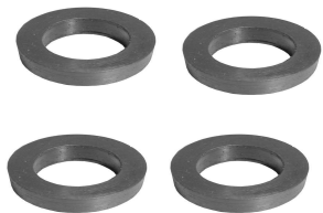
Uszczelniacze uchwytów dźwigiemek zaworowych. I model