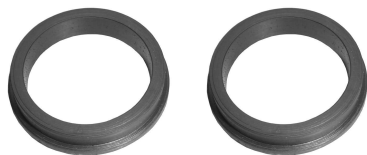
Uszczelniacze na górze uchwytów lampy przedniej