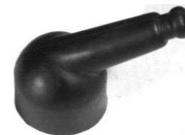
Oślona gumowa gaźnika