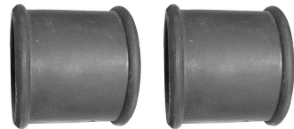
Mufy gumowe łączące filtr na skrzyni biegów z kolektorami dolotowymi